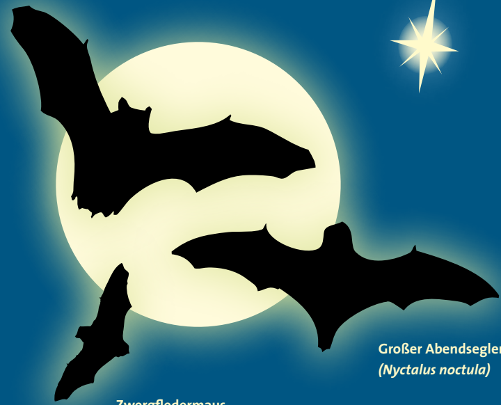
Großer Abendsegler ( Nyctalus noctula )